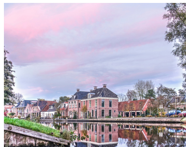
de Dokkumer Ee