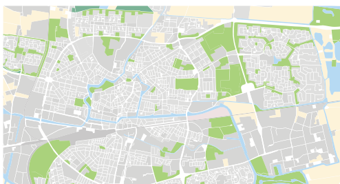
8 e eeuw