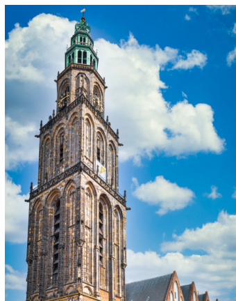
De Martinikerk in het hart van de stad