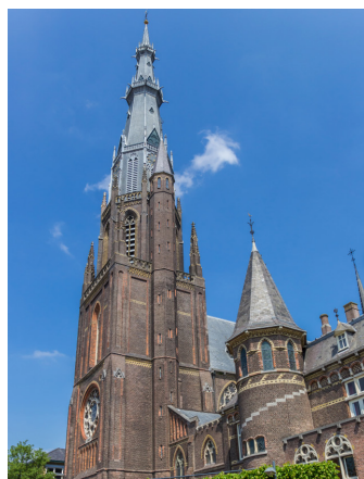
De Bonifatiuskerk in het hart van de stad