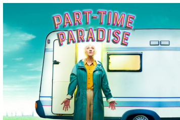
Skoft & Skiep, theater