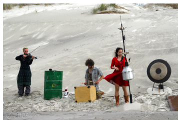
Via Berlin, muziektheater

Vertel aan je medespelers welke voorstelling je kiest. Vertel ook waarom.